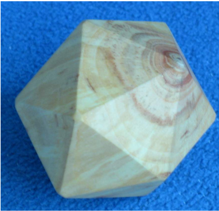
Ikosaeder (platonisch) 20 Dreiecke